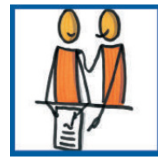
Grafik von Bonn Lighthouse e.V.