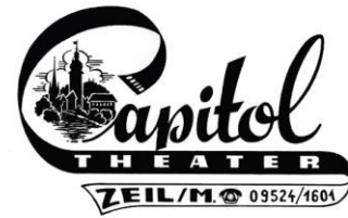
Foto-Kino Schneyer Untere Scheuerngasse 5 97475 Zeil am Main https://kino-zeil.de/