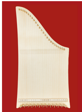
Modell „Standard“ ohne Rosette

Auf Wunsch auch Tenor/Bass-Besaitung G - g‘.