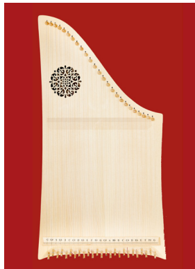
Modell „Standard“ mit Rosette